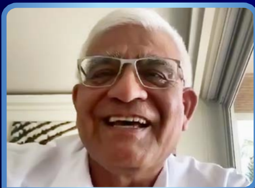
†MONS. MIGUEL CABREJOS VIDARTE.